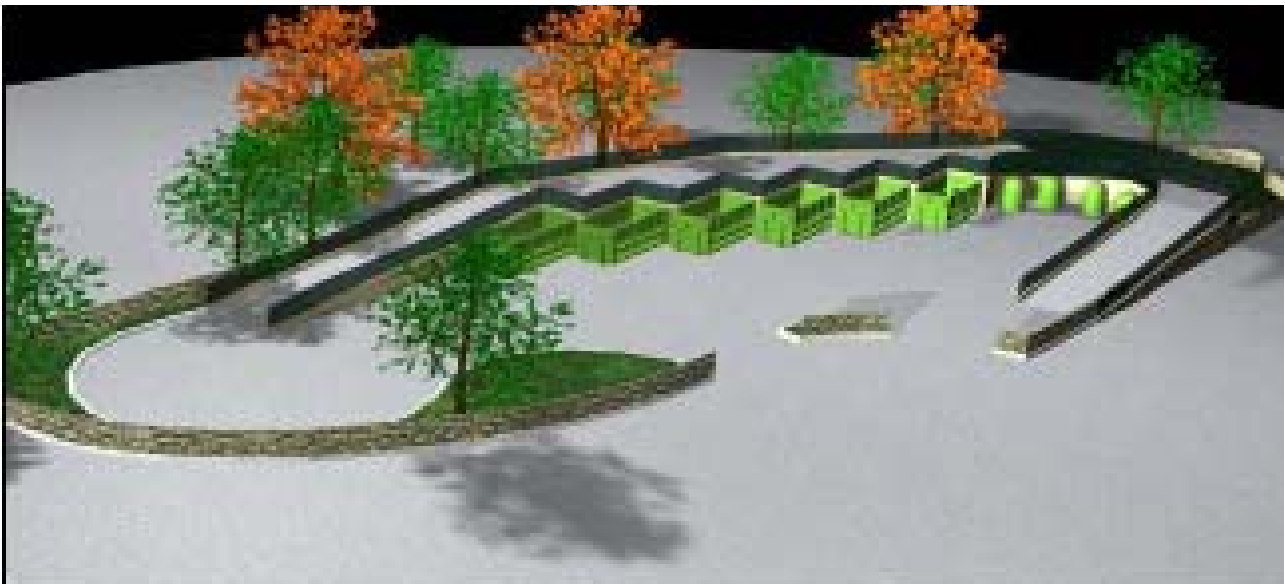
Layout Centro di Raccolta (cfr "Linee guida per l'adeguamento del Piano Gestione dei rifiuti della Regione Lazio" 2008)