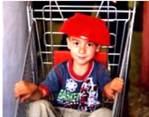
Matteo: esercitazioni per Genova

Ed ecco la scuola, un bene primario per l'istruzione e la cultura, ridotta in botteghe che competono tra di loro al servizio dell'impresa, dove va scomparendo la trasmissione sistematica e razio-