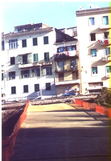
Frosinone - Rampa di lancio Via De Gasperi

La Ciociaria in questi anni ha subito anch'essa le devastanti conseguenze di decisioni prese quasi mai dai nostri Enti locali, colpevoli comunque di non aver opposto alcuna resistenza. Anzi, la nostra terra ha costituito e costituisce una sorta di laboratorio, di testa di ponte da occupare per favorire la presa di altri territori. Degli esempi?