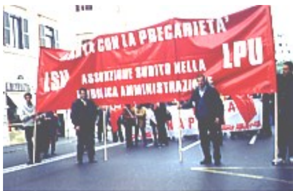
Lavoratori Socialmente Utili in lotta

Quando a Genova, in luglio, i grandi della terra si riuniranno per discutere di "architetture finanziarie", realmente e concretamente discuteranno in realtà anche delle concrete condizioni di vita e di lavoro di ognuno di noi, dell'insegnante e dello studente di una qualsiasi delle nostre scuole, dell'ammalato in dubbio se farsi visitare gratuitamente in ospedale o, sempre in ospedale, sempre dallo stesso medico, ma a pagamento, come visita privata (!); dell'operaio metalmeccanico di una fabbrica dell'indotto Fiat, del carpentiere di Boville Ernica, della commessa del "Continente", del giovane affittato per una settimana dall'Adecco o dalla Manpower, dell'operatore ecologico LSU del Comune di Veroli che dovrebbe accettare una